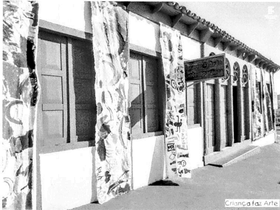
Criança faz Arte