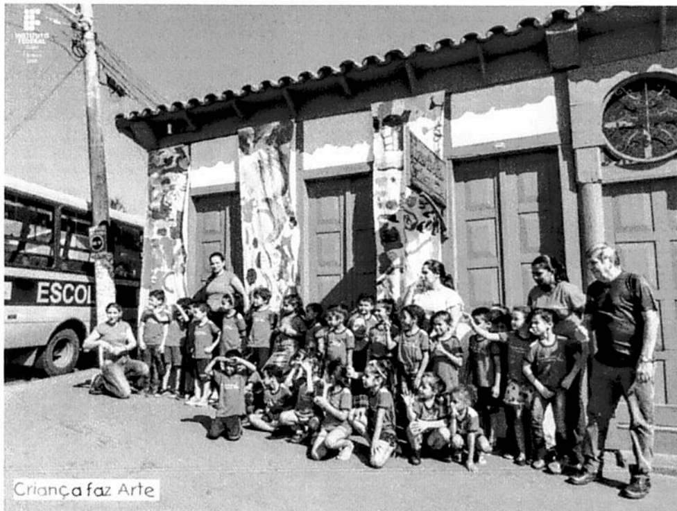
Criança faz Arte